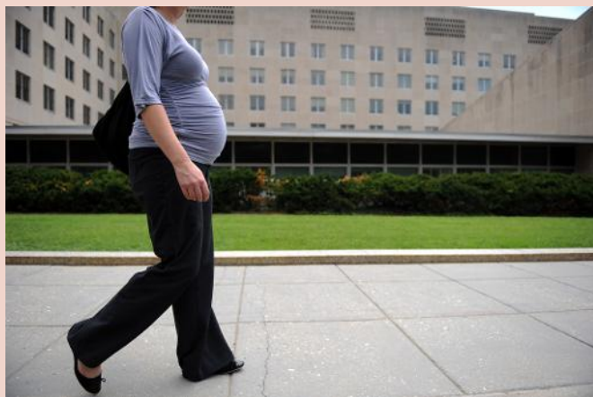
Une femme enceinte à Washington

Une jeune Américaine sur 200 déclare être tombée enceinte alors qu'elle était encore vierge, selon une étude publiée mardi dans le British Medical Journal (BMJ).